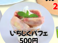
いちじくパフェ 500円