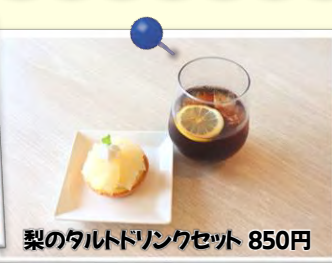
梨のタルトドリンクセット 850円