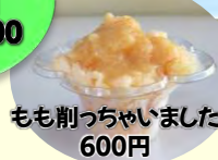
もも削っちゃいました 600円