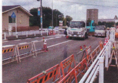
勝手塚線と白鳥線が交差するT字路交差点への信号機の設置等