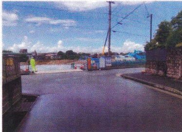
上志段味中学校正門前への横断歩道の設置