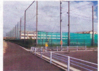
志段味東小学校周辺へのカーブミラー等の設置