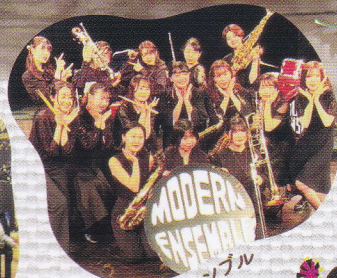
ジャズアンサンブル