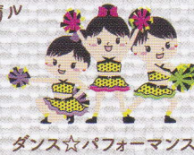
ダンス☆パフォーマンス