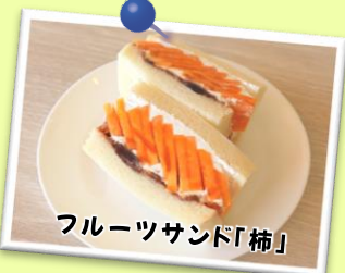
フルーツサンド「柿」