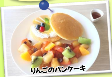
りんごのパンケーキ

11:00~15:30 土日祝は10:30より営業します。 オーターストップは15:00