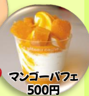
マンゴーパフェ 500円