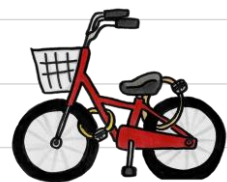
お店でも自宅でもツーロック