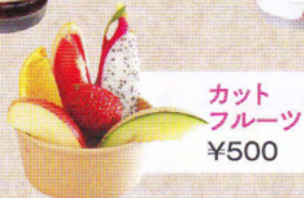
カット フルーツ ¥500