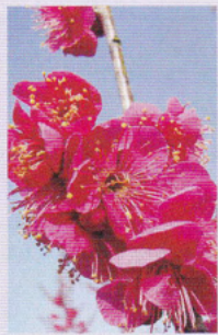
ウメ 2月中旬～3月中旬

3月から4月にかけて、順次園内を彩るウメ、スモモ、アーモンド、モモ、ナシの花をお楽しみいただけます。