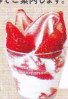
いちご パフェ ¥600