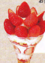
いちごの森の パフェ ¥1,500

植物や果実をイメージしたナチュラルテイストの空間でお食事やデザートをお楽しみいただけます。