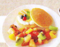
りんごの パンケーキ ¥1,000