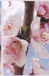
モモ 3月下旬～4月上旬