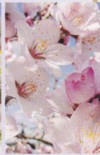
アーモンド 3月中旬～下旬