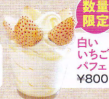
数量 限定 白い いちご パフェ ¥800