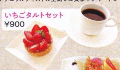
いちごタルトセット ¥900