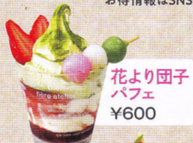
花より団子 パフェ ¥600

新鮮なくだものや野菜のほか、カットフルーツ、ジュースなどを販売! お得情報はSNS等でご案内します。