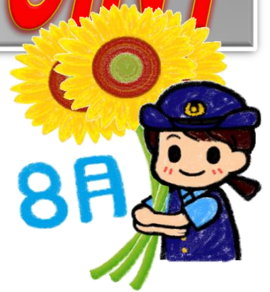
【8月 二輪車死者の年齢別】